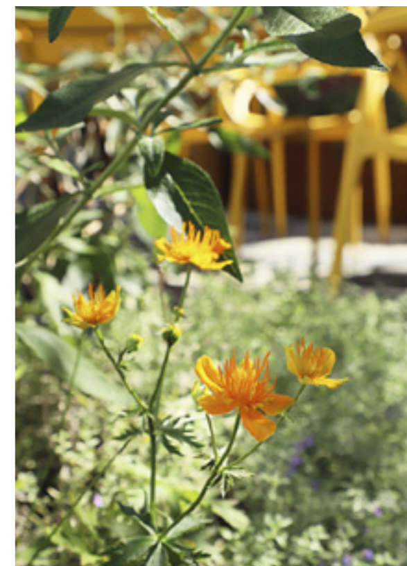
Trollium x cultorum 'Orange Globe'

Van cortenstaal zijn zowel in de voortuin als in de achtertuin verhoogde bakken gemaakt met een mooie, ronde belijning. Ze zorgen voor meer variatie in hoogte. Cortenstalen keerwanden bij de dijk zorgen voor meer gebruikruimte in de voortuin. Ook deze keerwanden hebben fraaie golvende lijnen. De dijk was overigens nog een hele uitdaging, aldus Fhreja. "Het waterschap heeft het ontwerp van de voortuin getoetst, omdat je niet zomaar in een dijk mag graven. Ook voor de trampoline was een vergunning nodig." De (ingegraven) trampoline staat namelijk in de voortuin en de kinderen vinden het heerlijk om zich hierop uit te leven. De voortuin ligt op het oosten. Het terrasje hier is dan ook bedoeld om de ochtendzon mee te pakken. Daarnaast is deze plek ook een eyecatcher, niet in de laatste