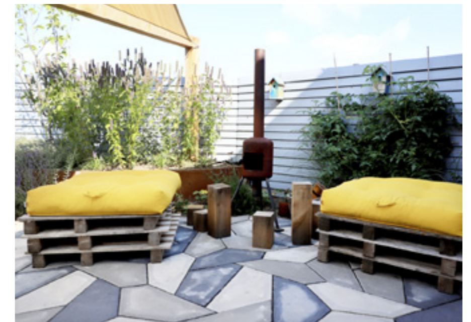
Oude pallets met zonnige zitkussens vormen een informele loungeplek.

Parksteentjes van Aquaflow zijn speciaal ontworpen om regenwater snel in de ondergrond te laten wegstromen; de afstandhouders in deze tegels zorgen voor brede voegen (6 mm). Voor een extra goede afwatering zijn de voegen in deze tuin gevuld met brekerzand. Dit is grover van structuur dan normaal invezgand. Hier is gekozen voor basalt brekerzand. Door de zwarte tint worden de voegen én het speelse tegelpatroon geaccentueerd. www.aquaflow.nl