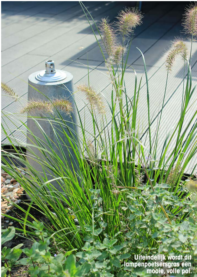
Uiteindelijk wordt dit lampenpoetersgras en Nepeta een mooie, volle pol.