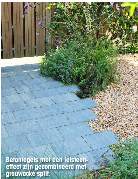
Betontegels met een leisteen-effect zijn gecombineerd met grauwacke split.

www.mulderhoveniers.nl (bestrating) tuineigenaren (vlonder) www.fhreja.nl (beplanting)