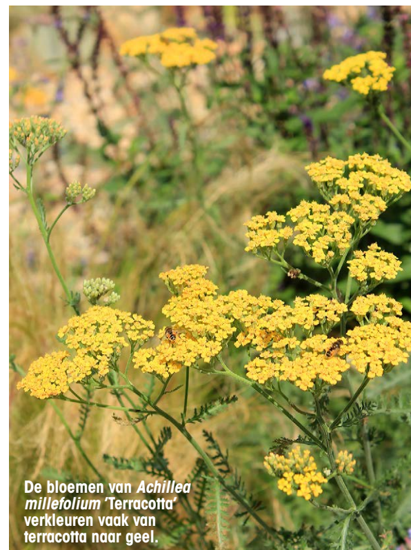
De bloemen van Achillea millefolium 'Terracotta' verkleuren vaak van terracotta naar geel.