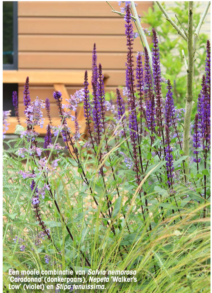
Een mooie combinatie van Salvia nemorosa 'Caradonna' (donkerpaars), Nepeta 'Walker's Low' (violet) en Stipa tenuissima .