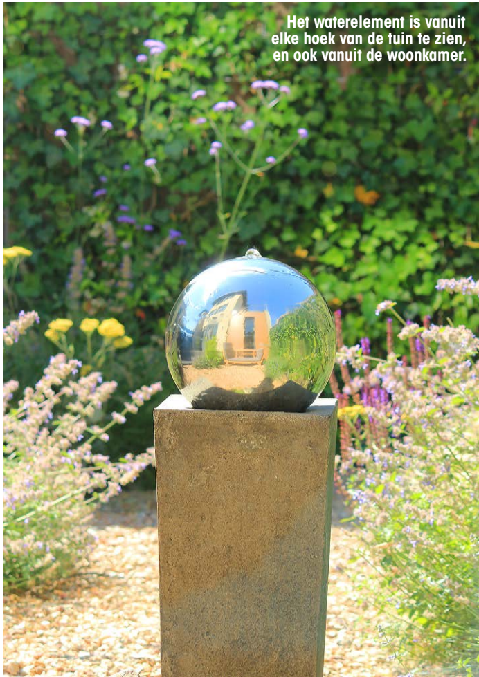
Het waterelement is vanuit elke hoek van de tuin te zien, en ook vanuit de woonkamer.