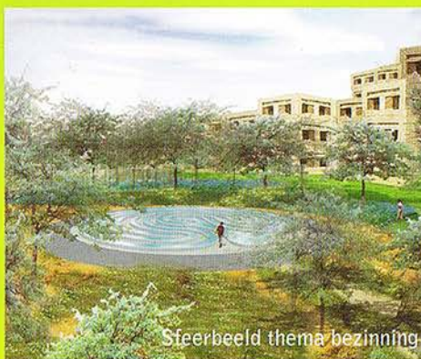
Sfeerbeeld thema bezinning

gezondheid voor de verschillende patiëntengroepen. De thema's zijn: Bezinning bij de psychiatrische afdeling, Energie bij de polikliniek, Relax bij de hotfloor en verpleegafdeling en Onthaal bij de entree van het ziekenhuis. Per thema zijn de ontwerpaspecten zo gebruikt dat de zintuigen geprikkeld worden en de gezondheid van de patiënt positief wordt beïnvloed. De gebruikte ontwerpaspecten zijn: beplantingsvorm, bloemvorm en grootte, bloemkleur, geur, geluid, zicht, licht, water, activiteit, aantal personen, sfeer, hoogte en algemene vorm.