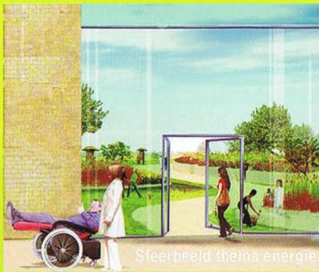
Sfeerbeeld thema energie

gezondheid voor de verschillende patiëntengroepen. De thema's zijn: Bezinning bij de psychiatrische afdeling, Energie bij de polikliniek, Relax bij de hotfloor en verpleegafdeling en Onthaal bij de entree van het ziekenhuis. Per thema zijn de ontwerpaspecten zo gebruikt dat de zintuigen geprikkeld worden en de gezondheid van de patiënt positief wordt beïnvloed. De gebruikte ontwerpaspecten zijn: beplantingsvorm, bloemvorm en grootte, bloemkleur, geur, geluid, zicht, licht, water, activiteit, aantal personen, sfeer, hoogte en algemene vorm.